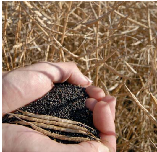
Die Preise für Ölsaaten sind seit 2006 kräftig angestiegen.

Der überaus kräftige Preisanstieg bei Getreide und Ölsaaten seit dem Jahr 2006 hat einige einmalige Bestimmungsgründe. Diese Preisentwicklung wird teilweise allein auf die zusätzliche Nachfrage nach Getreide und Ölsaaten für die Herstellung von Biokraftstoffen zurückgeführt. Der Anteil der Welternträge für die Verwendungslinie Bioenergie lag allerdings im Jahr 2007 noch unter 4 %. Demgegenüber ist die Nahrungsmittelnachfrage nach