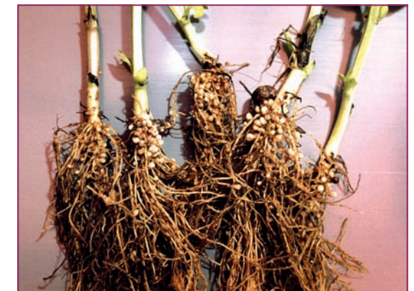
Abb. 5.2: Ackerbohnen sind mit ihrer großen Wurzelmasse und reichem Knöllchenbesatz eine gute Vorfrucht für Wintergerste und -Weizen.

Versuche mit Ackerbohnen, Erbsen, Weißer und Gelber Lupine (Jost 2003) zeigten eine unterschiedliche N-Assimilation der Arten an vier Versuchstandorten an, die von 121–319 kg/ha reichte (Tab. 5.9). Die Unterschiede zwischen den Standorten, dem Sandboden (Uelzen) mit nur 567 mm Niederschlag und dem schluffigem Lehm (Diepholz) mit 713 mm Regen/Jahr, fielen viel stärker aus als zwischen den Arten, z. B. zwischen Erbsen und Weißer Lupine. Da in diesem Versuch der pH-Wert und der Kalkgehalt nur in der Krume, nicht aber im Unterboden gemessen wurde, weisen nicht bei allen Arten die Böden mit pH 7 die höchste N-Assimilation auf.