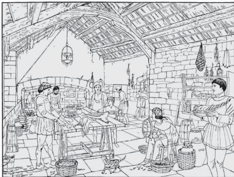
Küche im Mittelalter

rer Vorfahren übernahmen und weiter verfeinerten.