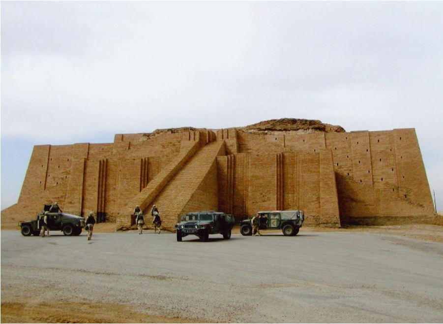
Hier fand man erste bildliche Darstellungen der Käseproduktion: Tempel von Ur im Zweistromland

portierten, verwandelte sich die Flüssigkeit durch Reste des Verdauungsferments, durch den Einfluss von Wärme und die ständige Bewegung in einen festen Kloß. Der erste Labkäse stand zur Verkostung bereit.