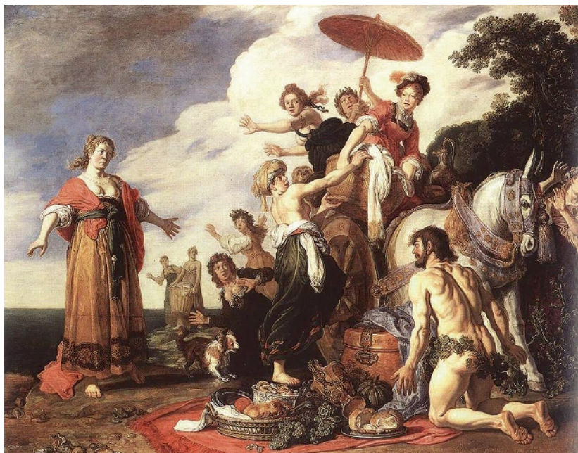
Grundnahrungsmittel lange vor unserer Zeit: Weintrauben und Käse